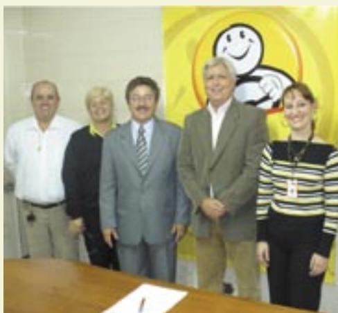
GVI Promotora / Banco Fibra

Amil - Planos de saúde especialmente pensados para os filiados do sindicato, seus familiares e funcionários.